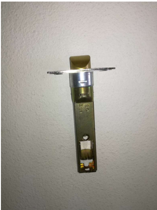
Γλώσσα 8 χιλιοστών