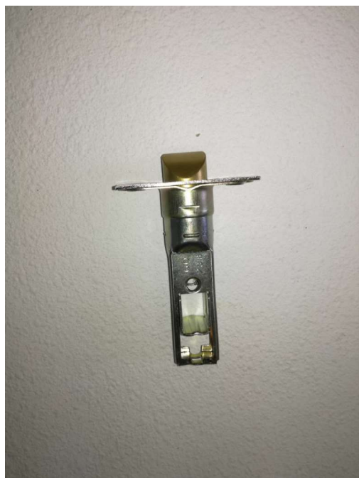
Γλώσσα 6 χιλιοστών